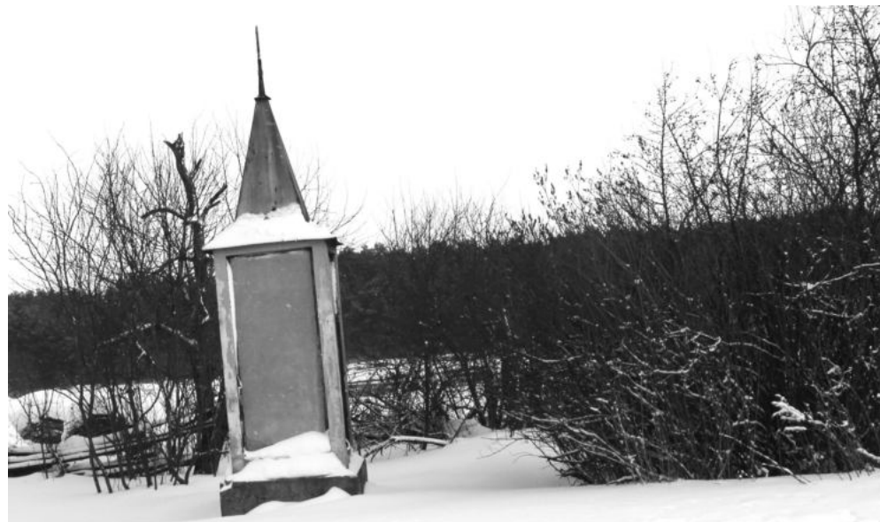
Памятник М.Е. Азеву в деревне Азевой подвергся вандальному нападению. Памятник планируется восстановить к юбилею Победы.

ID/5CBEE0CBC785500B3B6BED/DEN-POBEDY-IL-MOI-PRA-PRA-DED-GEROI-SOVETSKOGO-SOIUZA-5cd406d0ed7a4c00AEE44699