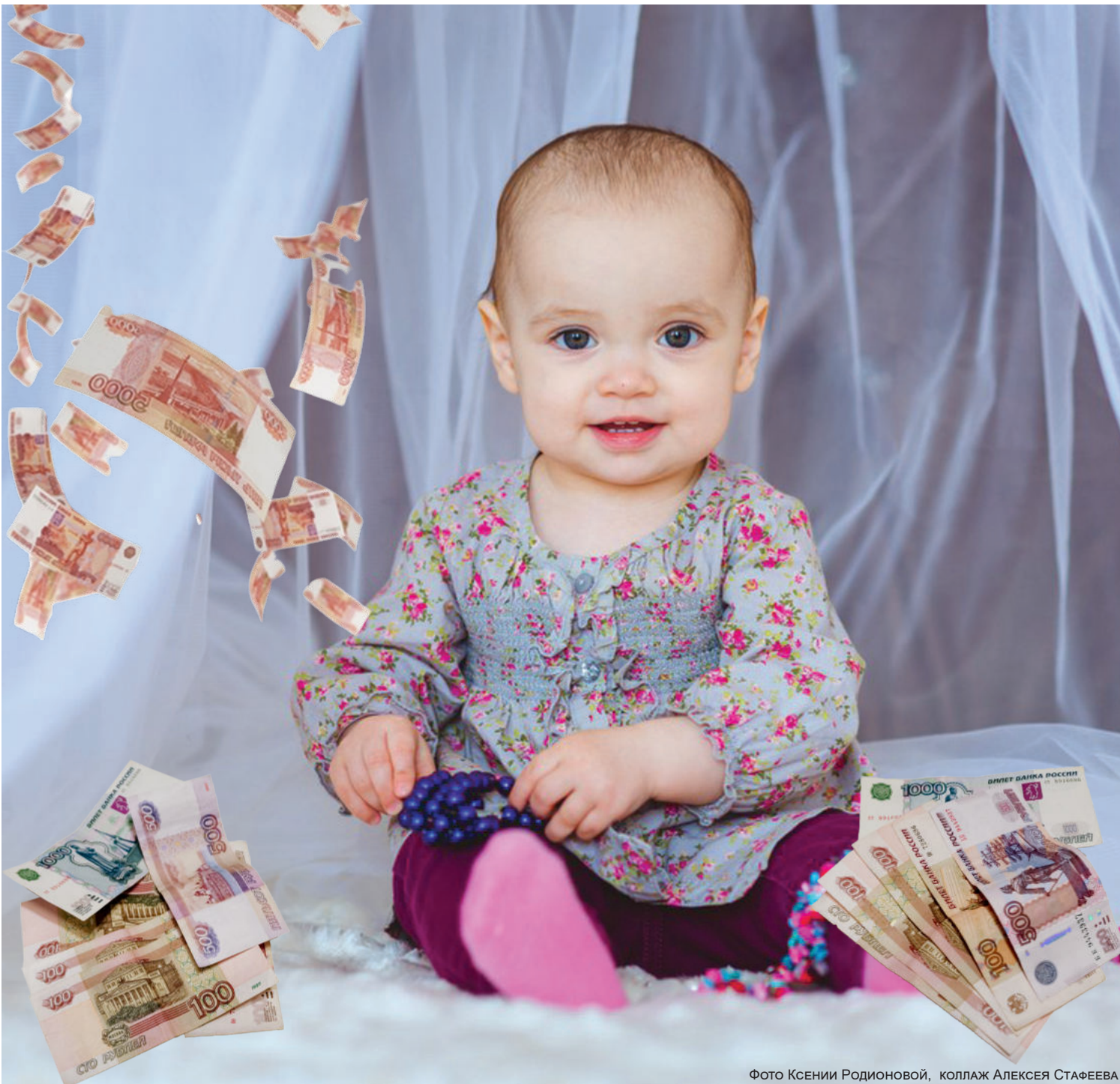
Фото Ксении Родионовой, коллаж Алексея Стафеева

РАЗМЕР ЕЖЕМЕСЯЧНОЙ ВЫПЛАТЫ СЕМЬЯМ С ПЕРВЕНЦЕМ: 11 514 РУБЛЕЙ. С ЯНВАРЯ 2020 ГОДА В СИЛУ ВСТУПИЛ ФЕДЕРАЛЬНЫЙ ЗАКОН «О ЕЖЕМЕСЯЧНЫХ ВЫПЛАТАХ СЕМЬЯМ, ИМЕЮЩИМ ДЕТЕЙ».